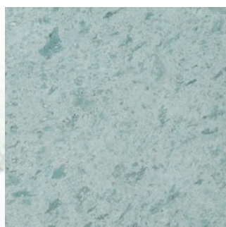
ダイヤモンド挽き