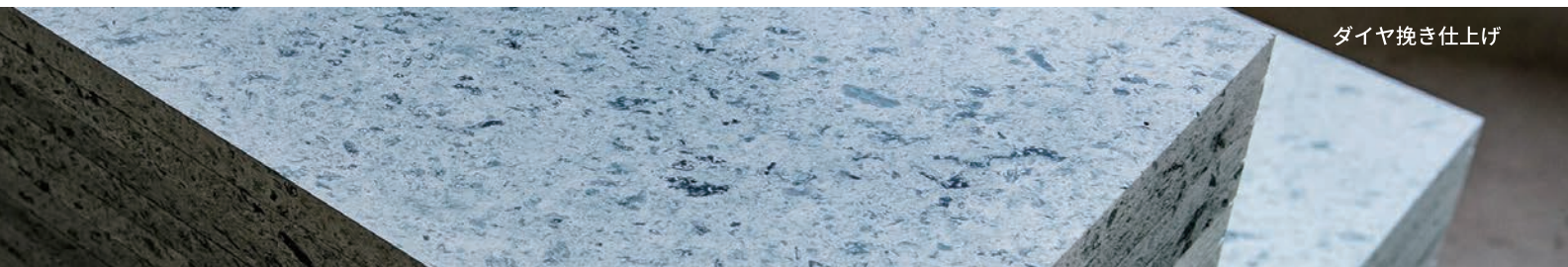
ダイヤモンド挽き仕上げ

柔らかく、水を吸着する多孔質のため温泉場でも滑りにくく、手触り・肌触りがとても良い。