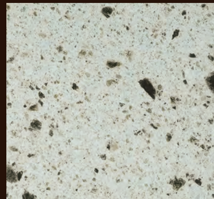
大谷石 中目 ダイヤ挽き