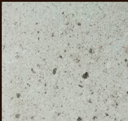
大谷石 細目 ダイヤ挽き